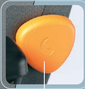
Apoyo lumbar mecánico de 5 posiciones