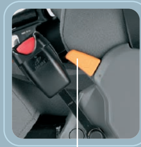
Ajuste de ángulo del respaldo