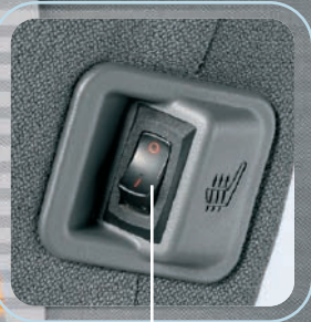
Interrupteur de chauffage